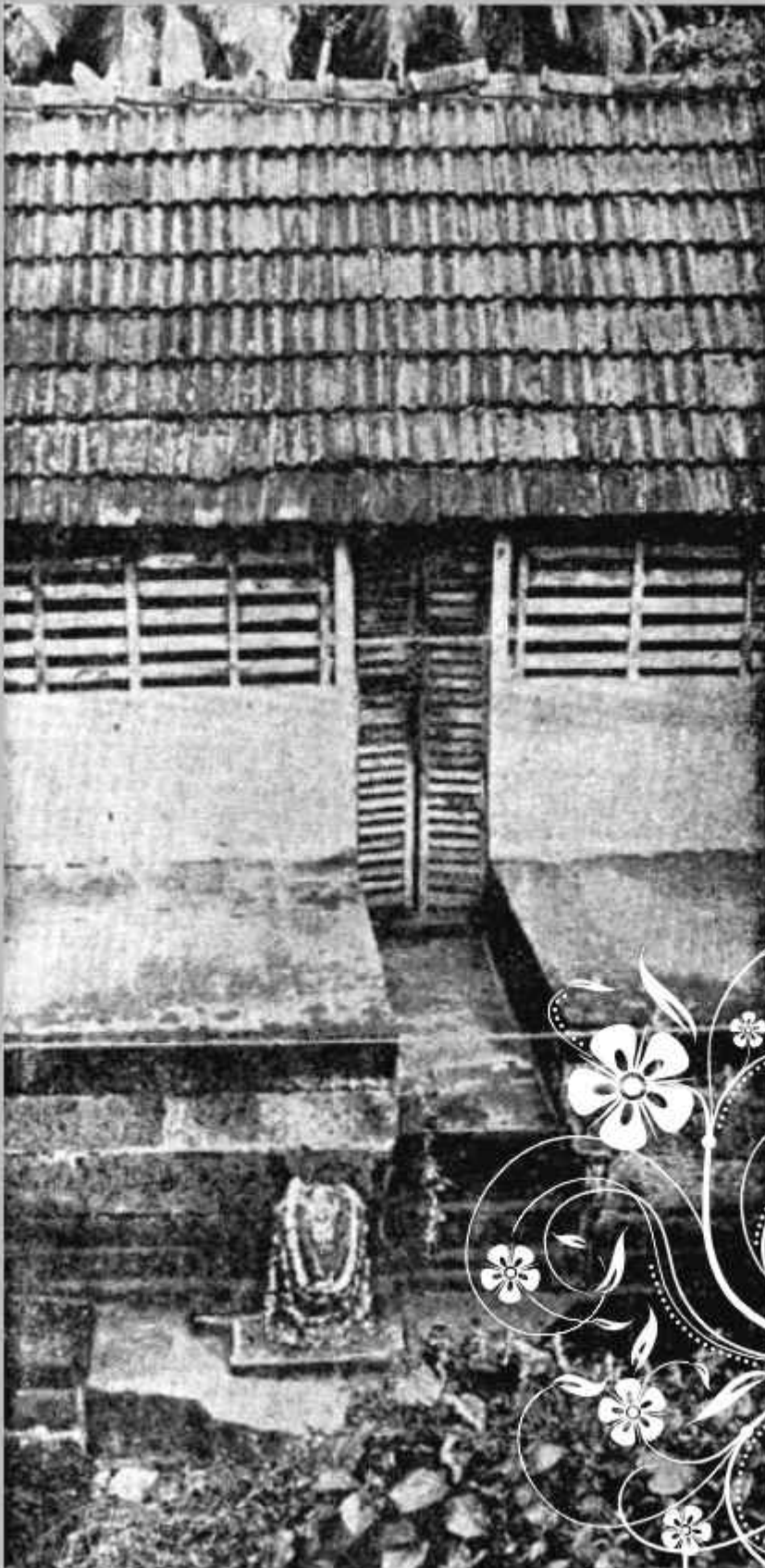
പനച്ചിക്കാട് സരസ്വതീക്ഷേത്രം (പഴയകാല ചിത്രം)