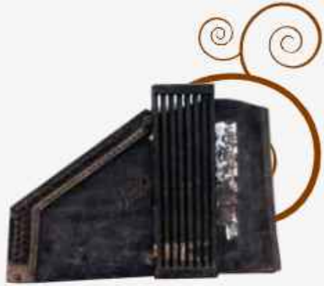
കോഡ് സിത്തർ (നൂറിൽപ്പരം വർഷങ്ങൾക്കു മുൻപുള്ള വാദ്യോപകരണം)